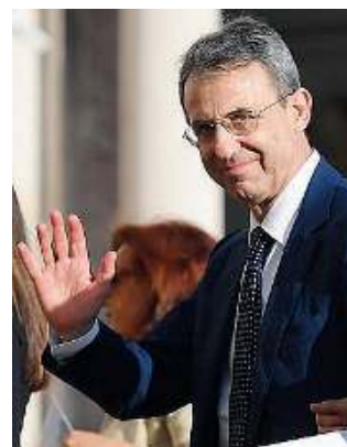
Il ministro. Sergio Costa

■ «La qualità dell'aria va oltre i confini amministrativi e travalica ogni differenza di colore politico. La salute dei cittadini e la tutela dell'ambiente sono delle priorità nella sfida delle Regioni del Bacino Padano per un'aria più pulita. Entro il 2020 l'obiettivo è armonizzare e rendere omogenee le norme e le misure applicate in un territorio che da solo pro-