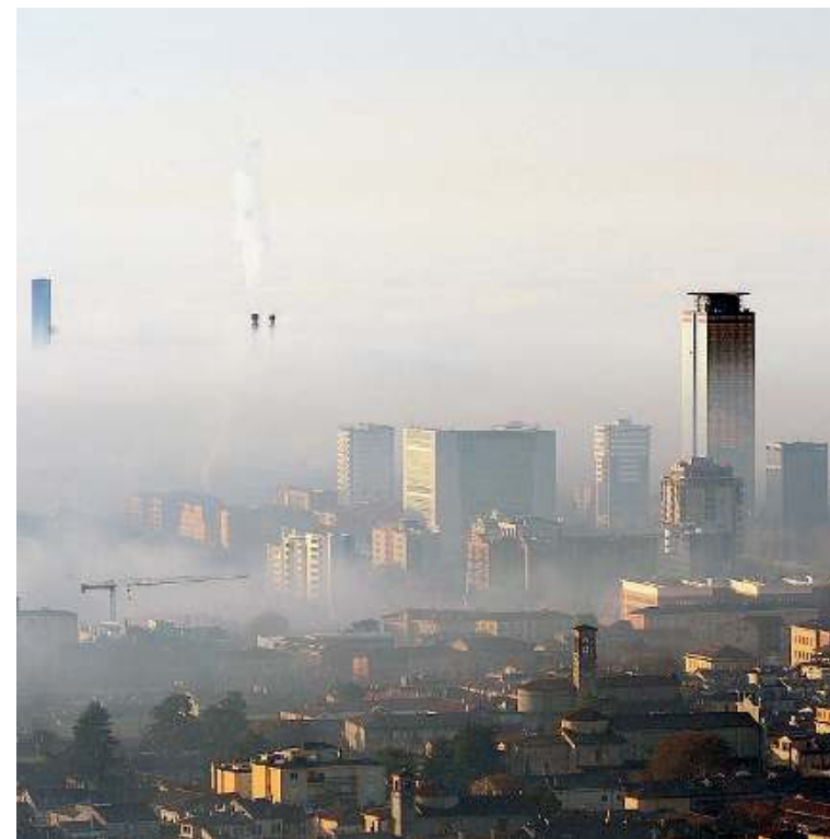
Smog. Brescia è ritenuta città sensibile sul fronte dell'inquinamento

Nel caso di Brescia, d'altronde, l'obiettivo è di arrivare per la prima volta nel 2025 a non superare il limite dei 35 giorni di PM10 fuorilegge. //