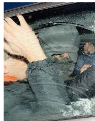
L'arresto. Haida portato in caserma

to il sottotetto la mattina di mercoledì, passando dal retro». Ha così evitato i carabinieri davanti alla casa. Ieri i militari hanno recuperato i cellulari dei due sequestrati. A PAG. 12