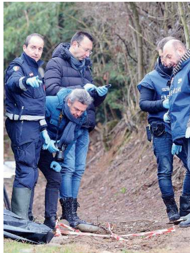
Le indagini. Tecnici del Sis sul luogo dove è stato lasciato il cadavere

IL COMMENTO Quei corpi di donne sfregiati dal disprezzo e pure privati di qualunque dignità