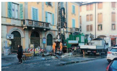
Lavori in corso. L'operazione complessiva costerà 7-8 milioni di euro