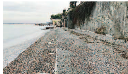
Passeggiata. Altri 100mila euro per salvare il salvabile lungo il lago

glieria nuova dovesse funzionare, allora si penserà a soluzioni più drastiche e certamente più costose: una, il sovrizzo del camminamento.