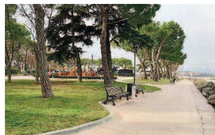
Giardini della Maratona. Per i giardini stanziati 180mila euro di fondi

to con l'Autorità: per far fronte alle lagheggiate, ci si prepara al ripascimento delle scogliere. Vale a dire alla collocazione di massi (forse come quelli «storici» del lungolago Battisti, ma questo aspetto dovrà essere valutato con la Soprintendenza) che possano fermare sabbia, detriti, ghiaia e quant'altro, e di conseguenza proteggere dall'invasione la passeggiata. Un'invasione che viene puntualmente segnalata ad ogni occasione: la passeggiata, bellissima anche perché così vicina all'acqua, diventa però pressoché impraticabile e ogni qualvolta il lago è appena mosso. Sul piatto, tra Comune e Autorità, ci sono 100mila euro: al consorzio spetterà l'espletamento delle procedure di gara per l'affidamento delle opere, al Comune la progettazione e la direzione dei lavori. E se nemmeno con la sco-